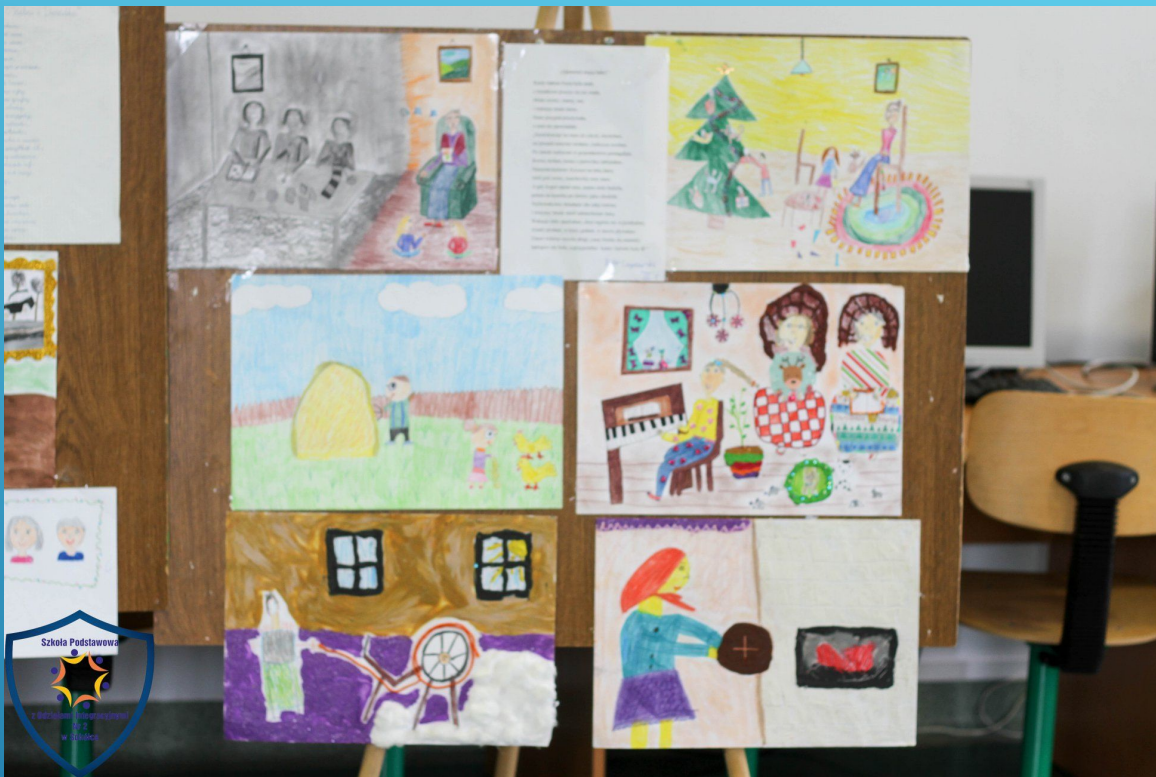
Międzyszkolny Konkurs Plastyczno-Literacki „Opowieść mojej Babci, mojego Dziadka”